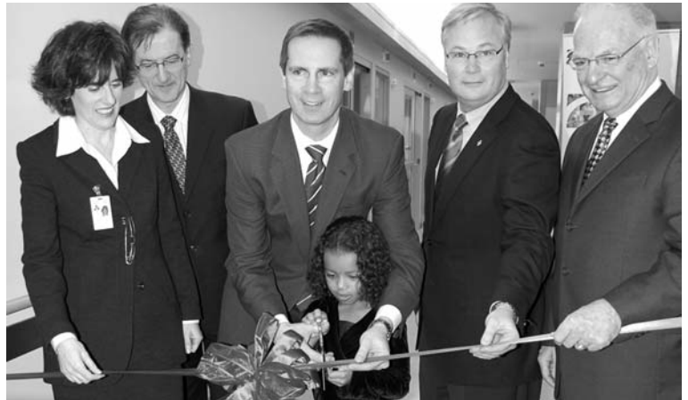
Dalton McGuinty, premier ministre de l'Ontario, a inauguré officiellement le nouveau Centre de cancérologie de L'Hôpital d'Ottawa le 27 novembre 2009.

www.ohfoundation.ca/campaign/index_f.asp .