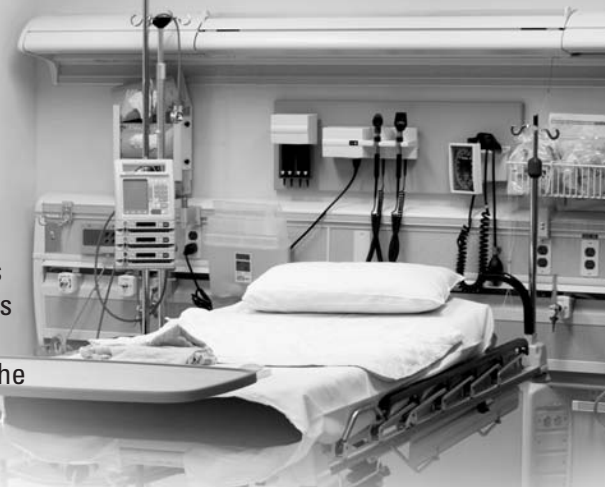
Urgence du Campus Civic Ouverture : septembre 2006

Dans ce numéro de Soutien Santé, nous nous proposons de vous démontrer les répercussions de vos dons. Vous pourrez ainsi prendre connaissance des points saillants de la transformation dont L'Hôpital d'Ottawa fait actuellement l'objet – les nouvelles installations, le nouvel équipement et les programmes de recherche élargis – en plus de découvrir les chefs de file médicaux qui ont choisi de travailler à L'Hôpital d'Ottawa en raison de ces améliorations. Les réalisations énumérées dans le présent numéro sont un témoignage de la générosité de milliers de donateurs qui, comme vous, comprennent combien il est important d'appuyer les soins de santé dans notre collectivité.