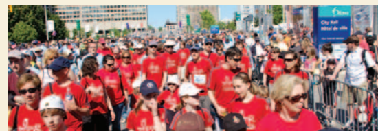
L'équipe de PIRP recueille des fonds pour la recherche sur le Parkinson dans le cadre du Défi Courez pour une raison.

Pour en savoir plus, veuillez composer le 613-798-5555, poste 19821, ou faire parvenir un courriel à l'adresse evenements@hopitalottawa.on.ca .