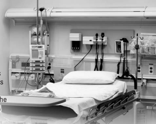
Urgence du Campus Civic Ouverture : septembre 2006

Dans ce numéro de Soutien Santé, nous nous proposons de vous démontrer les répercussions de vos dons. Vous pourrez ainsi prendre connaissance des points saillants de la transformation dont L'Hôpital d'Ottawa fait actuellement l'objet – les nouvelles installations, le nouvel équipement et les programmes de recherche élargis – en plus de découvrir les chefs de file médicaux qui ont choisi de travailler à L'Hôpital d'Ottawa en raison de ces améliorations. Les réalisations énumérées dans le présent numéro sont un témoignage de la générosité de milliers de donateurs qui, comme vous, comprennent combien il est important d'appuyer les soins de santé dans notre collectivité.