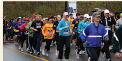
Les participants à l'édition 2010 de la Course aux squelettes ont recueilli plus de 65 000 $ pour les soins aux patients et la recherche sur l'arthrite et en orthopédie à L'Hôpital d'Ottawa.

Inscrivez-vous aujourd'hui en ligne sur le site www.fondationho.ca et préparez-vous pour la course de votre vie!